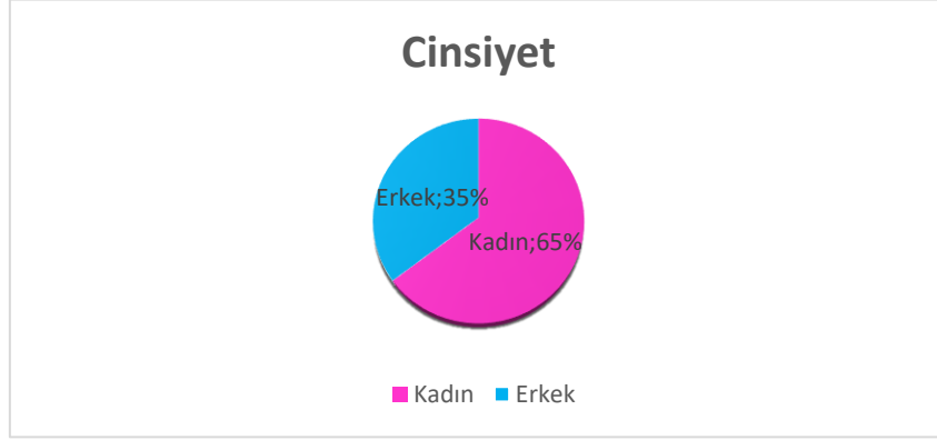
Şekil 1. Cinsiyet

Maltepe Üniversitesi öğrencileri tarafından ekteki anket (EK 1) 2021 yılı Haziran ayında doldurulmuştur. Toplam 12021 öğrenciye anket gönderilmiş olup, 408 öğrenci ankete yanıt vermiştir.